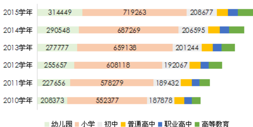
图：2010—2015年东莞市教育各阶段在校生规模与结构 单位：人

3. 教育发展格局更趋开放。 全市公、民办教育进一步协调发展，民办教育办学秩序得到进一步规范，办学质量进一步提高，民办义务教育阶段的标准化学校比例和优质学校比例逐年增加。“新莞人子女就学工程”实施成效显著，2011—2015 年外来务工人员随迁子女入读义务教育公办学校人数年均增加 10%以上；目前，全市公办义务教育学校随迁子女在校生人数占公办义务教育学校在校生总数的 53.88%。建立和实施局领导分片联系机制和区域校际联盟机制，推行优质学校结对帮扶薄弱学校，推进初中学校“1+1”结对帮扶工作，实现共同提高和“抱团发展”，全市教育均衡发展水平明显提高。高中布局调整基本完成，普职比合理调控，普通高中质量稳步提升，中职教育品牌效应凸显。